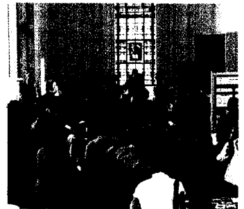
Fachtagung „Häusliche Gewalt“ Seite 28