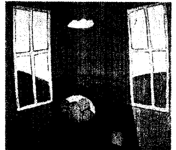
Ausstellung: „Lustgarten“ in Dresden Seite 35