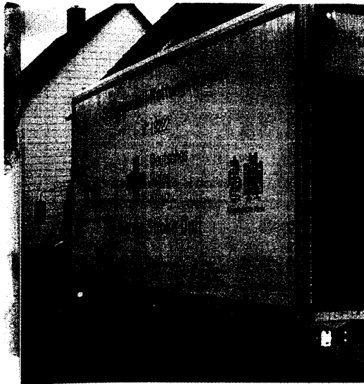
Zeit ist Hirn: Je schneller ein Schlaganfall erkannt und behandelt wird, desto besser sind die Prognosen. Seite 32