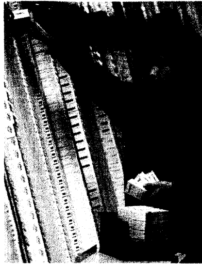
Eine Studie im Auftrag des Phagro bescheinigt der Branche eine hohe Effizienz. Seite 38