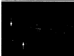
Sonografische Darstellung einer Tenosynovitis der langen Bizepssehne bei Polymyalgia rheumatica.