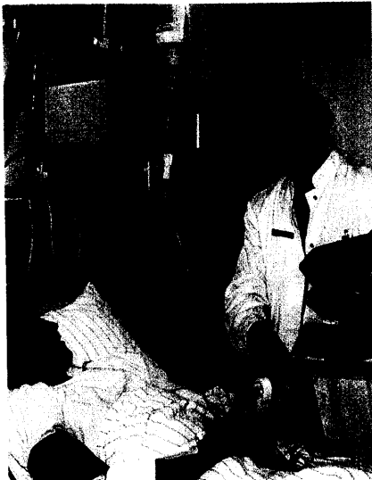
Fachwissen zu Arzneimitteln und deren richtige Anwendung kann Kosten senken. Seite 6