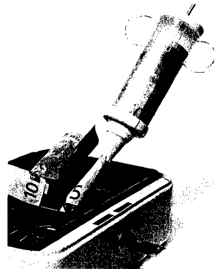
Finanzspritze vom Staat: Zukünftig erhalten mehr Studenten Geld aus der BAFöG-Kasse. Seite 46