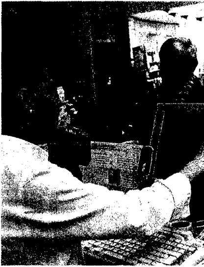
Die AOK hat 64 Wirkstoffe ausgeschrieben. Die Software wird deshalb weiter über die Arzneiauswahl mitentscheiden. Seite 6