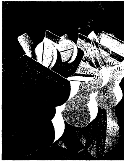
Nierenzellkarzinom: Warum die neuen Therapeutika den bisherigen Standardtherapien überlegen sind. Seite 14