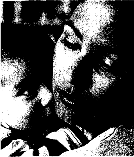
Die Fürsorge der Mutter prägt Kinder fürs Leben: Bestimmte Gene werden langfristig aus- oder angeschaltet. Seite 32