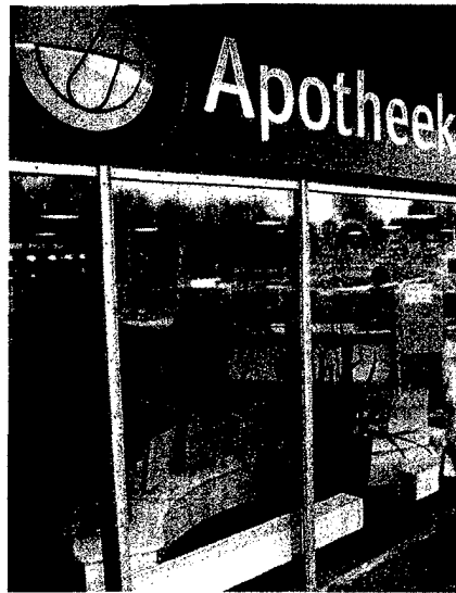
Fremdbesitz auch in Deutschland? In Studien dürfen Experten vermuten, was Apotheker erwartet. Seite 36