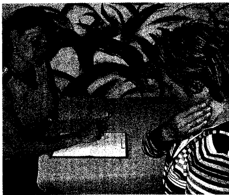
In der Anamnese erfragt der Therapeut verschiedene Aspekte, wie zum Beispiel die Lebenssituation vor dem Unfall sowie frühere Diagnosen und Behandlungen Seite 871