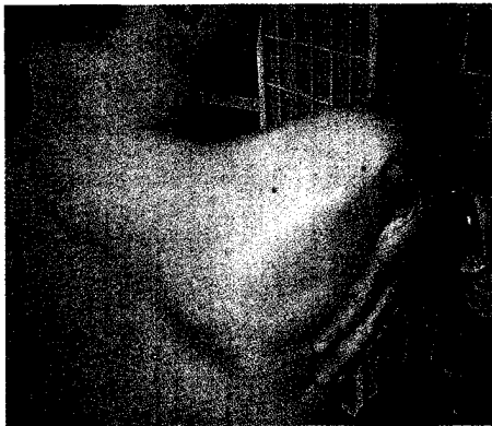
Korrektes Handling der paretischen Schulter. Das Schulterblatt wird in der Anteversion vom Therapeuten mitgeführt und unterstützt Seite 841