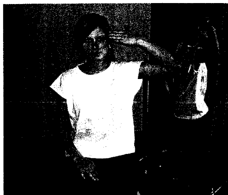
Flexorsynergie: Der Patient wird aufgefordert, die Hand zum Ohr zu führen; die Schulterretraktion ist wichtig Seite 902