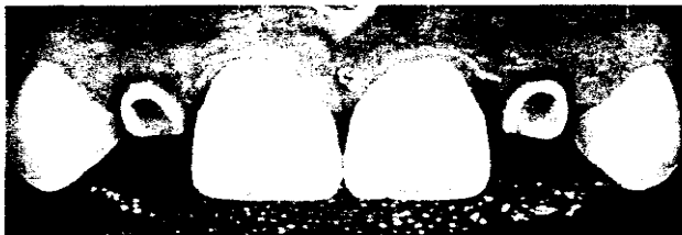
Für ein natürliches Lächeln