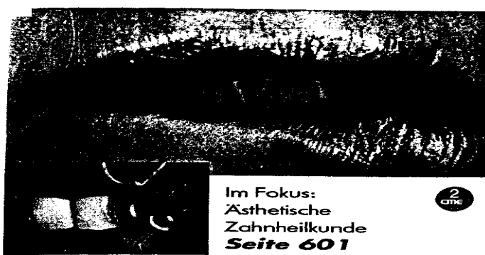
Im Fokus: Ästhetische Zahnheilkunde Seite 601