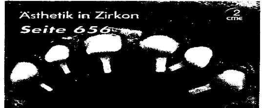
Ästhetik in Zirkon Seite 656