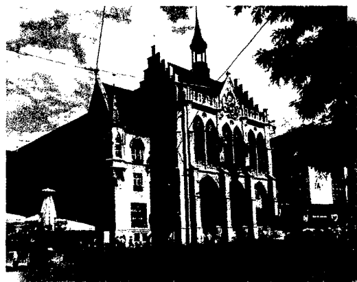
Rathaus am Fischmarkt