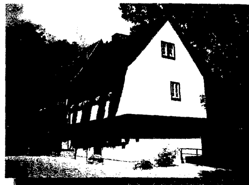
Studentenbursa der ehemaligen Uni am Kreuzsand