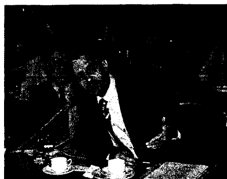
Gast der Vertreterversammlung war der SPD-Bundestagsabgeordnete Eike Hovermann