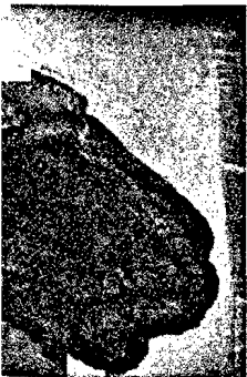
Das Gossypibom – intraoperativer Befund.