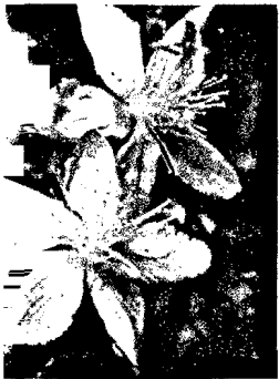
Johanniskraut: Hypericum perforatum .