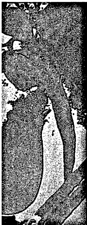
Titelbildvorlage: Was sehen Sie? (s. Mediquiz Seite 1563).