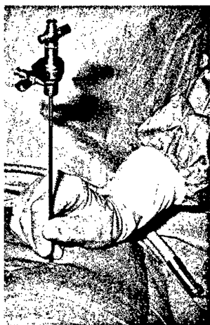
Die Mini-Laparoskopie: Einbringen von Trokar und Verres-Nadel unter Valsalva-Manöver.