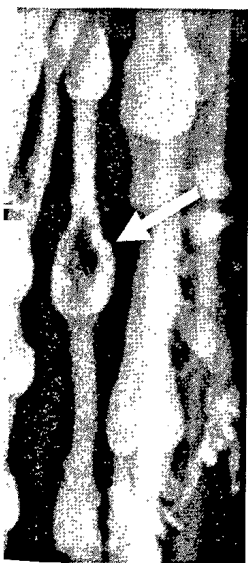
Blutflussener Thrombus im Unterschenkel.