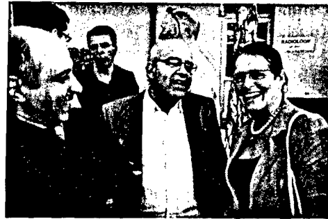
Beim 14. IZZ- Presseforum