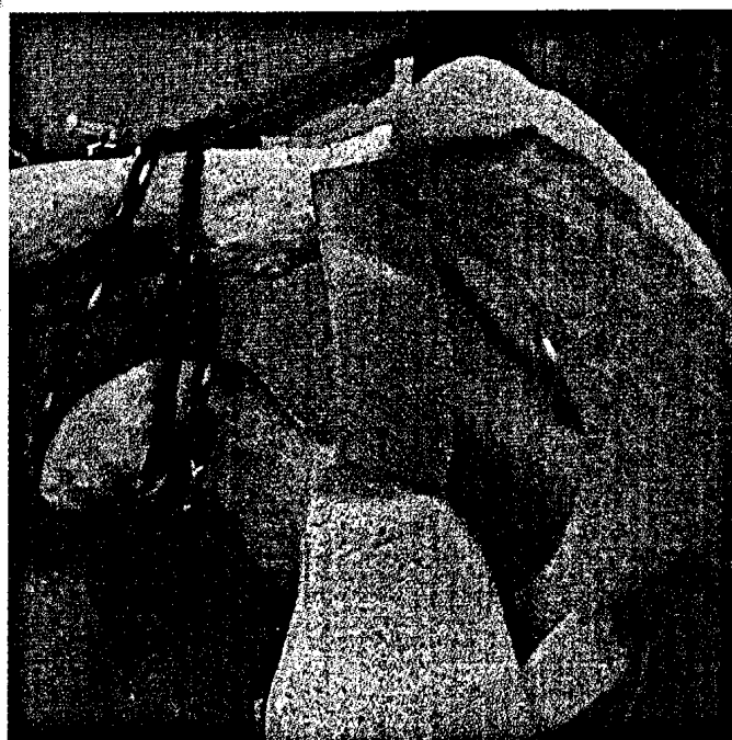
Augmentation mit TightRope™ ▶ Seite 122