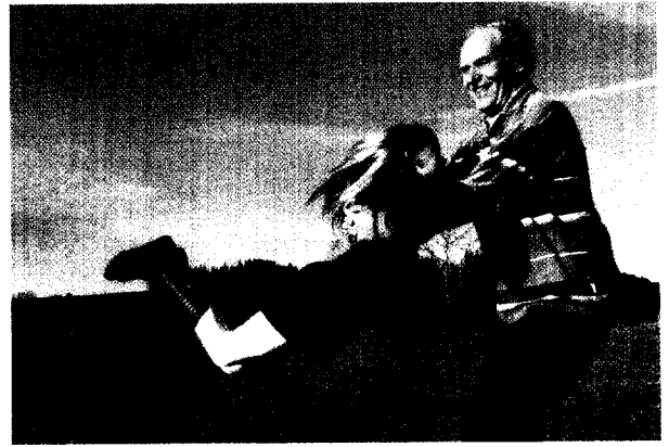
Wer sind unsere Kunden von morgen – und was erwarten sie? (Seite 18 ff.)