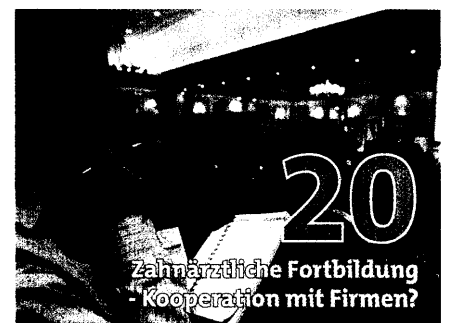
20 Zahnärztliche Fortbildung - Kooperation mit Firmen?