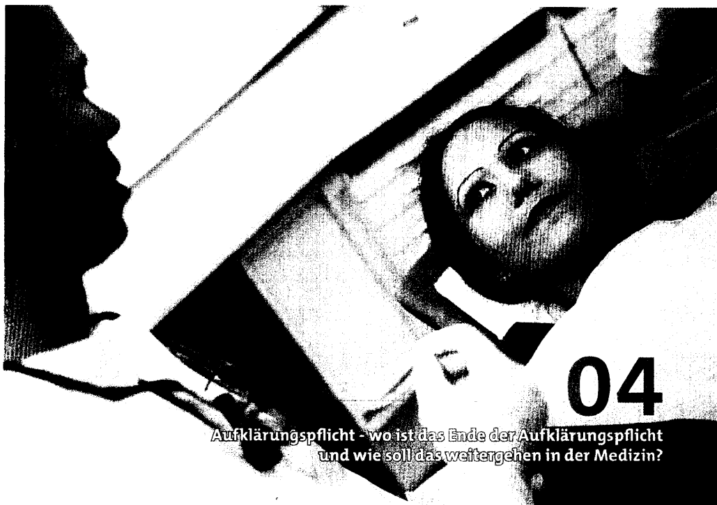
04 Aufklärungspflicht - wo ist das Ende der Aufklärungspflicht und wie soll das weitergehen in der Medizin?