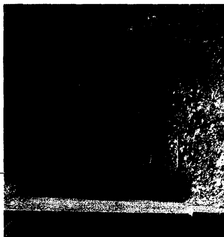
Schon kleine Einheiten helfen: Regelmäßiges Treppensteigen verbessert die Fitness