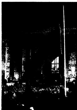
3. Oktober 1990: Vor dem

„Ein Drittel unserer Hausärzte ist älter als 60 Jahre, Nachwuchs ist derzeit nicht in Sicht“, so Feld-