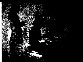
Aristide Maillol Der Blumenkranz (1889) Bildbetrachtung auf Seite 198 dieser Ausgabe