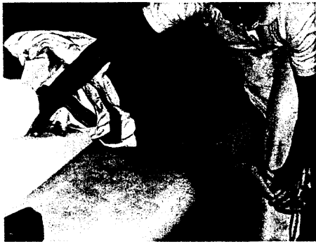
Mobilisation des Nervensystems nach David S. Butler. Bei Tension mit SLR (Straight Leg Raising) in verschiedenen Variationen und ULNTs beobachtet man eine vorübergehende Tonuserhöhung Seite 1377