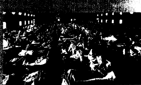
674 Die Spanische Grippe 1918/19 in Nürnberg Manfred Vasold