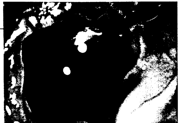
Nicht alle entarteten Polypen sind so gut sichtbar. Die Versteckten findet das neue Hilfs-System