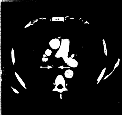
NSCLC: Typische subcarinale Lymphknotenmetastasierung im CT