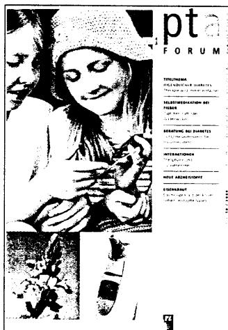
In dieser Ausgabe finden Sie das Supplement PTA-Forum 10/08.