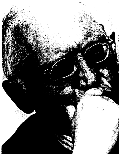
Das von EU-Kommissar Günther Verheugen geplante Pharmapaket stößt nicht nur bei Heilberuflern auf Ablehnung. Seite 6