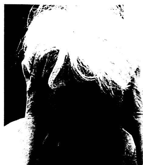
Die Arzneistoffsuche zur Behandlung von Morbus Alzheimer läuft auf Hochtouren. Seite 20