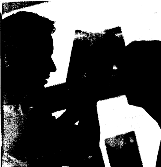
Eine Verhärtung der Lunge ist die gefährlichste Komplikation bei Sklerodermie. Wie die Krankheit zu erkennen ist, lesen Sie ab Seite 34.