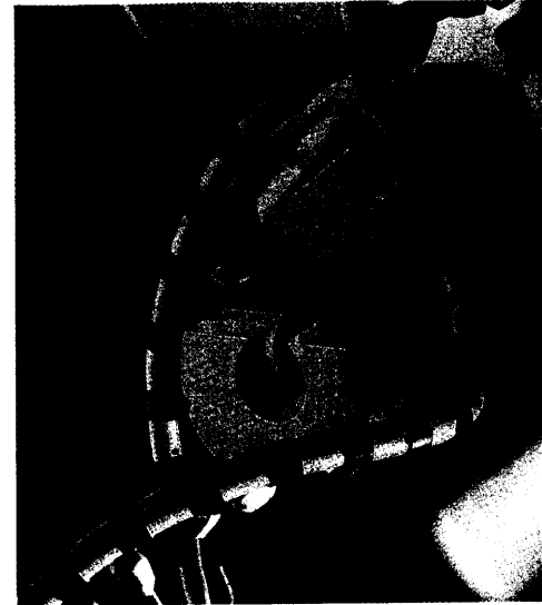
Die erbliche Stoffwechselerkrankung Mukoviszidose ist bis heute nicht heilbar. Die Suche nach neuen Wirkstoffen läuft weltweit auf Hochtouren. Seite 24