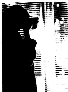
Schlafstörungen erhöhen das Sturzrisiko von Frauen über 70 Jahren.