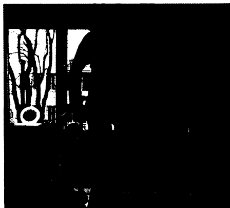
Beim Laufbandtraining ist für eine therapeutische Fazilitation auf eine korrekte Gewichtsbe- und -entlastung zu achten sowie eine Hüftextension des hemiparetischen Beines Seite 678