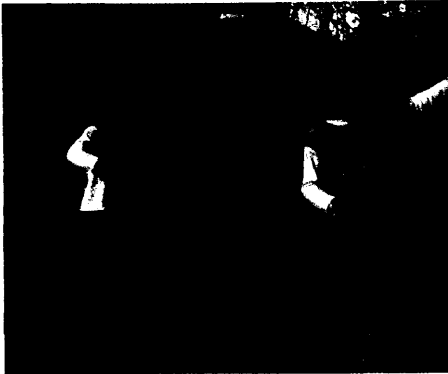
Treppauf und Treppab – eine Therapieübung für Kinder mit Knickfuß, die spielerisch in den Alltag integriert werden kann; die Übung wird »Nurejew« genannt Seite 667