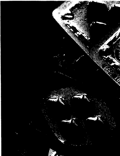
Gefälschte Arzneimittel bringen oft mehr Gewinn als Heroin oder Kokain. Seite 6