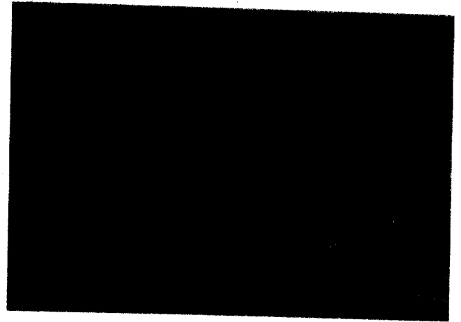
Physiologische und funktionelle Bisshebung mit Vollkeramik Seite 100