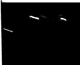
Identifikation der Ursache eines „Critical Incident“. Eine verrostete Schraube führte zur nicht korrekten Anbringung einer Armstütze und zum „Absturz“ des fixierten Patientenarmes.

betragen diese 3,95 € pro Bestellung. Ab 50 € Bestellwert erfolgt die Lieferung von 100 Exemplaren gratis. Lieferungen außerhalb D) werden die anfallenden Versandkosten weiterberechnet. Schweizer Preise