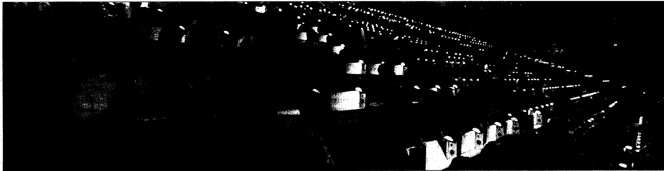
Im großen Saal des Berliner Kongress-Zentrums wurde gestern der Hauptstadtkongress eröffnet. Seit 10 Jahren ist der Kongress Informationsplattform und Ideenbörse zugleich.