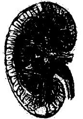
36— Nierenerkrankungen in der Schwangerschaft