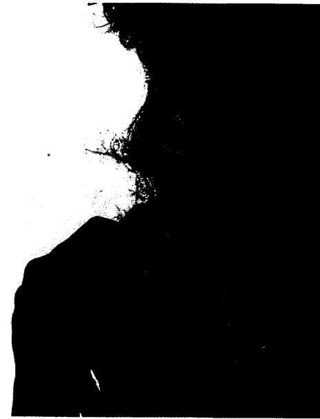
Essen macht Spaß: Was beim Essen im Gehirn passiert und wie der Appetit reguliert wird, lesen Sie ab Seite 62.

Marktkompass 72 / Rezensionen 76 / Forum 78 / Personalien 107 / Kalender 110 / Firmenkalender 114 / Stellenmarkt 119 / PZ-Markt 139 / Impressum 177 /