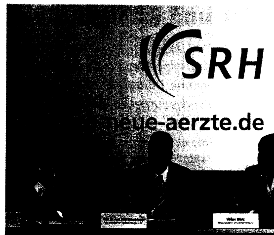
Initiativen gegen den Ärztemangel: Die SRH- Kliniken werben mit Ausbildungsangeboten, Sachsen fördert Studierende. Seite 68