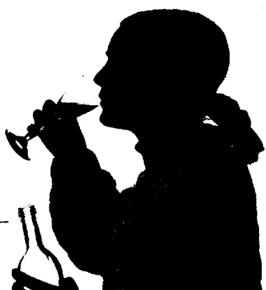
„Nur“ ein Gläschen zuviel? Patient verharmlost das Problem, Arzt fühlt sich auf unsicherem Terrain