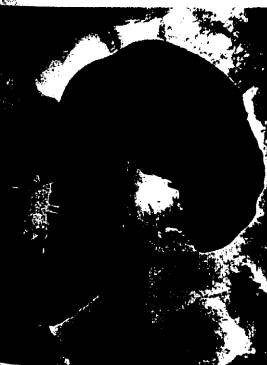
Dünndarm-Doppel- kontrastdarstellung (s. Seite 1065).