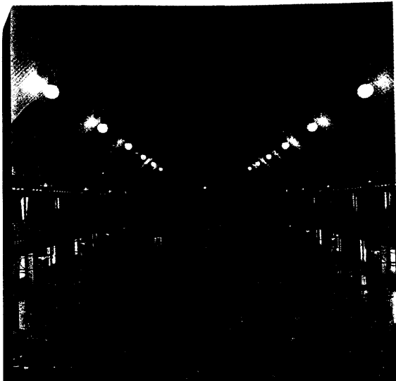
700 Apotheker kamen nach Meran und hörten die Forderung von Magdalene Linz, den Versandhandel zu verbieten. Seite 6