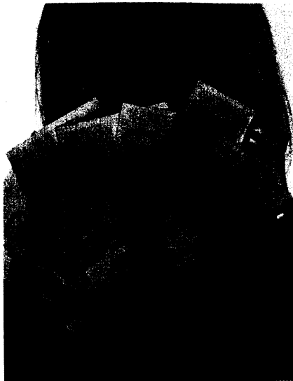
Novo Nordisk bietet Ärzten Geld für das Verschreiben von Insulinanaloga des Herstellers an. Kritiker halten das für unethisch. Seite 42