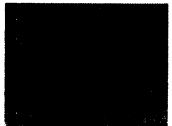
Trichinenkrankheit Seite 222