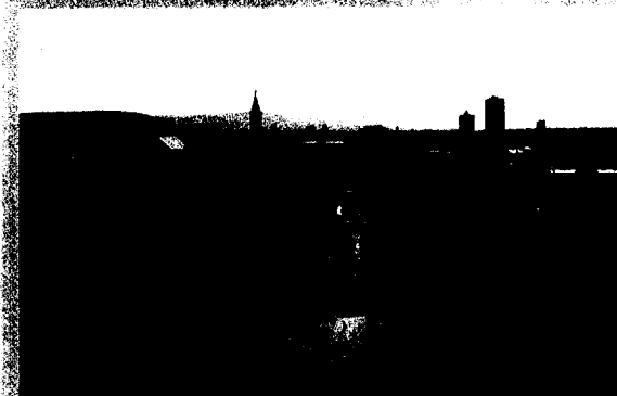
Alle Abstracts und Vorträge des 2. Internationalen Kongresses für Osteopathische Medizin sind ab Seite 40 für Sie zusammengestellt. Auf Seite 64 und 65 finden Sie das komplette Kongressprogramm. Bitte www.fozonline.de