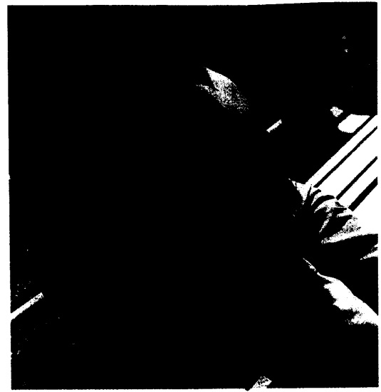
In der Pipeline: Tesamorelin könnte demnächst bei HIV-Patienten mit Lipodystrophie zum Einsatz kommen. Seite 28