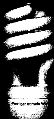
Weniger ist mehr Wert

contest kennt die Einsparpotenziale im Klinikbereich und kann weit über 25% der internen Dienstleistungskosten einsparen, und zwar nicht auf Schaltern der Mitarbeiter.