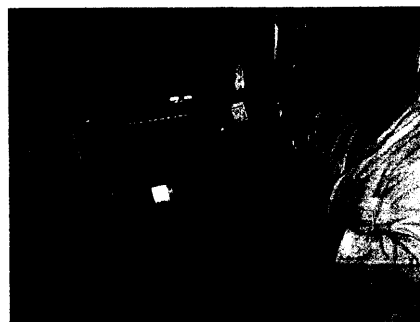
Eine hochwertige Prothesenversorgung bedarf qualifizierter Orthopädie-Techniker.