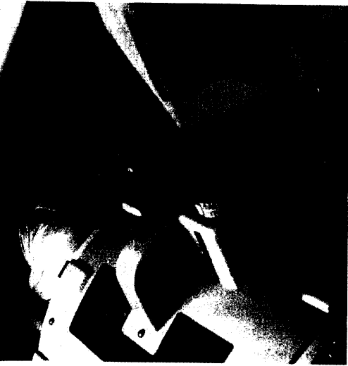
Hyperthermie in der Krebstherapie: Eine Überwärmung lässt den Tumor schrumpfen und erhöht den Behandlungserfolg. Seite 34