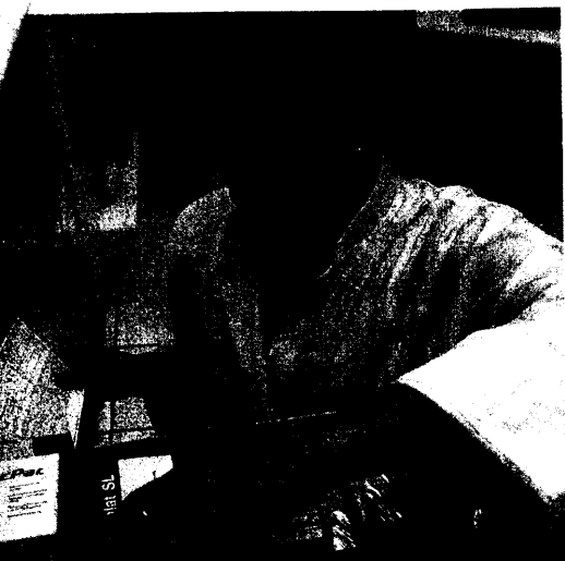
Apotheker und Pharmaindustrie werden wohl noch eine Zeit mit den Rabattverträgen leben müssen. Seite 6