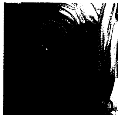
COXIB ODER NSAR? Die Therapiewahl bei Patienten mit Gelenk-Erkrankungen sollte sich stets am Risikoprofil orientieren.