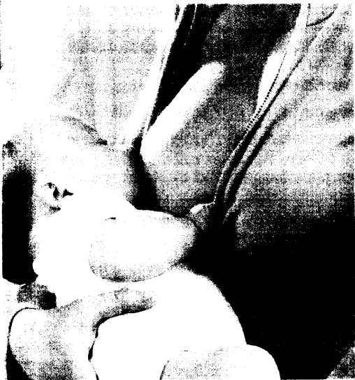
Stillen kann der Entstehung von Allergien vorbeugen. Welche Maßnahmen es noch gibt, lesen Sie ab Seite 50.