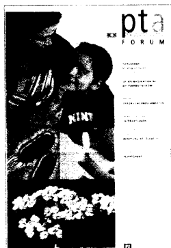
In dieser Ausgabe finden Sie das Supplement PTA-Forum 4/08.

Marktkompass 64 / Rezensionen 70 / Forum 72 / Personalien 97 / Kalender 100 / Stellenmarkt 109 / PZ-Markt 133 / Impressum 147 /