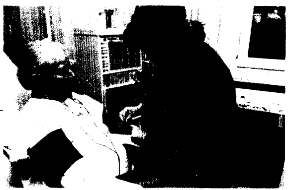
Oftmalige Dialyse: Für Betroffene und das Gesundheitssystem eine riesige Belastung