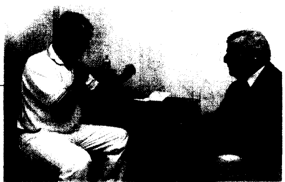
Patientenvertreter betonen, wie wichtig es ist, dass Ärzte die Diagnose Alzheimer sensibel und geduldig vermitteln