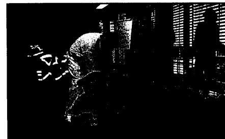
Rettungsdienstpersonal schult sich in "Selbstschutz Intensiv - Seminaren".