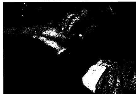
Anforderungen an RettAss aus der Berufspraxis