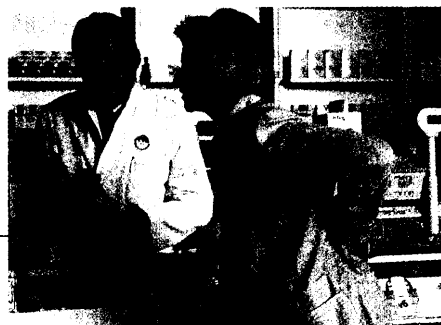
Rückenschmerz-Patienten brauchen mehr als einen Apotheker