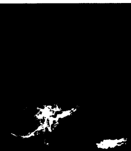
Was sehen Sie? (s. Mediquiz S. 775).